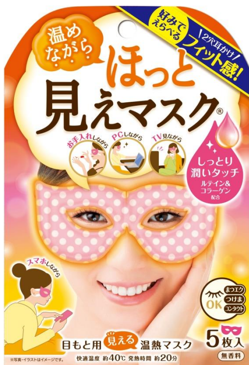
温活女子会プロデューズ「ほっと見えマスク」 5枚入り 640円（税抜）