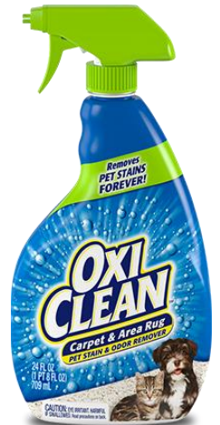
オキシクリーン カーペットクリーナー ペットによる汚れ用 709ml / 1,500円（税抜） （約700プッシュ分）

「オキシクリーン」は、米国チャーチ&ドワイト社が全世界26カ国で展開する酸素系漂白剤のトップブランド。酸素の泡で衣類のシミ・汚れを強力洗浄&消臭もでき、キッチンのお掃除など様々な場面で洗浄力を発揮します。日本国内においても累計販売本数200万個を突破しております。※