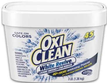
オキシクリーン ホワイトリバイブ 粉末タイプ 1360g / 1,980円（税抜） （お洗濯時に使用して約45回分）