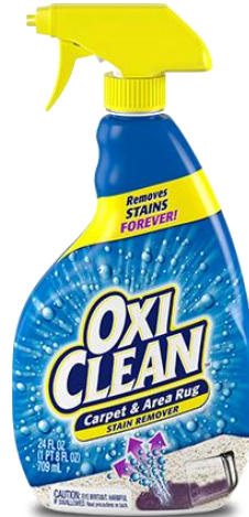
オキシクリーン カーペットクリーナー 709ml / 1,500円（税抜） （約700プッシュ分）