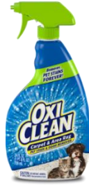
オキシクリーン カーペットクリーナー ペットによる汚れ用 709ml / 1,500円 (税抜) (約700プッシュ分)