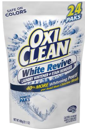
オキシクリーン ホワイトリバイブ パックタイプ 600g / 1,680円（税抜） （25g×24回分）