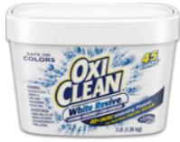
オキシクリーン ホワイトリバイブ 粉末タイプ