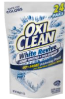
オキシクリーン ホワイトリバイブ パックタイプ 600g / 1,680円 (税抜) (25g×24回分)