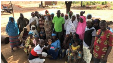
シアバターを届けてくれている村の人たち