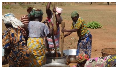
シアの実を洗う、ベナンの女性

古くから、ベナンではシアの実からシアバターをつくり、現地の様々な生活シーンで使われてきました。しかし海外企業がシアバターを大量に調達するようになり、シアバターを加工する前のシアの実の状態での輸出が増加。シアバターの伝統的な加工技術が途絶えてしまう危険性がうまれました。このプロジェクトでは現地のシアバター加工技術の伝承にくわえ、日本で受け入れられる品質のものづくりに挑戦しています。そのために現地に日本人スタッフも派遣し、現地の体制づくり、人材育成、シアバターの品質向上、設備構築など、調達・製造・輸出の仕組みづくりを行いました。