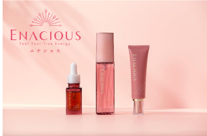
※スキंपीース姉妹ブランド：ENACIOUS(エナシヤス)

スキंपीースは、アフリカ ベナン共和国（以下ベナン ※1）産シアバターを原料に使用した、無添加設計（※2）スキんケア・ボディケアブランドです。ベナン産のシアバターは、グラフィコが推進する産業支援プロジェクト「フィール・ピース」プロジェクト でベナンの自生のシアの木から採取し精製した無農薬シアバターを通じて現地での産業を支援し、輸入。スキंपीースを購入すると、ベナンの産業が活発になり、「自立」と「子供たちの幸せ」につながります。お陰様で、スキंपीースシリーズは累計出荷数187万個突破しました。（※3）