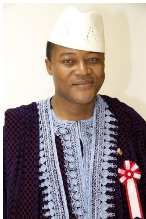
IFE国際財団代表、前駐日ベナン共和国大使 ゾマホン・イドゥス・ルフィン氏