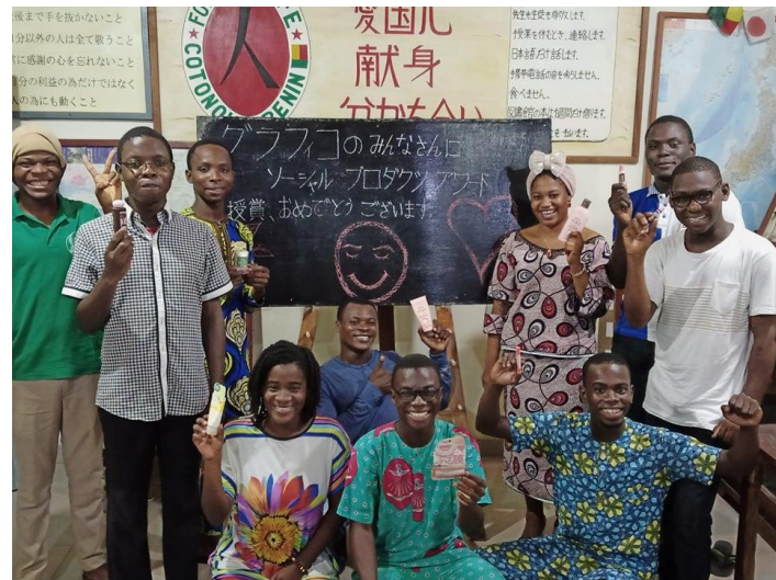
ベナン共和国 国際IFE財団 たけし日本語学校生徒の皆様

ソーシャルプロダクツ・アワードの受賞、ありがとうございます。skin PEACEの中に入っているシアバターは、私たちの国、ベナン共和国のものを選んでくれました。日本以外の国は、シアの実だけを買って、自分の国でシアバターにしますが、皆様はシアバターを作るベナンのお母さんたちに仕事をくれます。そして私たち日本語学校の生徒にも、日本と仕事をする機会をくれます。私たちは、日本の皆様にベナンの質のいいシアバターを送れるように、もっと、がんばります。これからも、よろしくおねがいします。