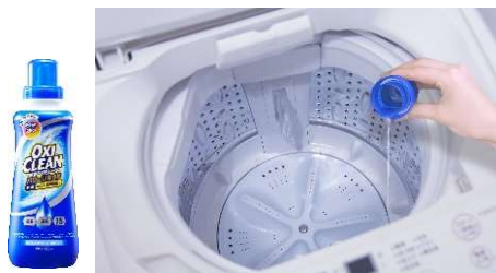
オキシクリーンパワーリキッドを使った オキシ足し