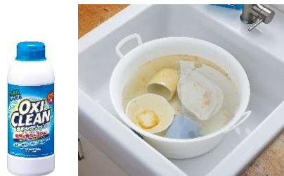
オキシクリーンを使用した 食器のオキシ漬け

衣類用の漂白剤として広く使われている液体タイプの酸素系漂白剤は、洗濯洗剤だけでは落としにくい汚れとニオイを落としてくれるお役立ちアイテムです。汚れは落としたいけど手間はかけられないという忙しい方には、簡単に使える液体タイプの「オキシクリーン パワーリキッド」はおすすめです。衣類の抗菌・ウイルス除去ができるのもポイントですね。一方、粉末タイプの「オキシクリーン」は、頑固な汚れやニオイのついた衣類の洗濯に加え、食器の茶渋を落としたり、窓ガラスの汚れにも使えたりと家中のお掃除でお使いいただけます。まずは洗濯には液体タイプの「オキシクリーン パワーリキッド」、お掃除には「オキシクリーン」と使い分けてみてください。