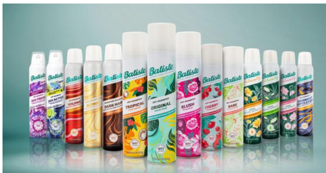
<グローバル展開ラインアップ>