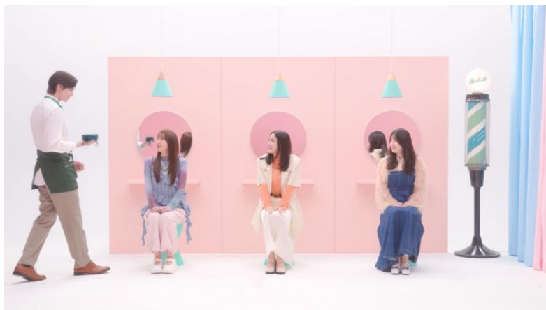
* 髪質※アプデサロン コンセプトムービーを疑似体験 ※髪表面の質感のこと。

※1 2022年1月から2025年3月末時点までのバティストブランドシリーズ累計。自社調べ。企画品・自社オンラインショップを含む出荷数。※2 スタイル効果による。 ※3 髪表面の質感のこと。